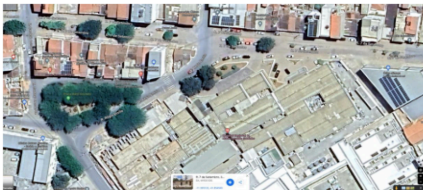
Localização do Imóvel Avaliando (Coordenadas geográficas: 11°18'18.4"S 41°51'17.8"W)